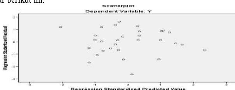
Gambar : Uji heteroskedastisitas Berdasarkan output scatterplot

Uji heteroskedastisitas bertujuan untuk menguji apakah dalam model regresi terjadi ketidaksamaan varian dari satu pengamatan ke pengamatan yang lain. Pengujian heteroskedastisitas menggunakan metode grafik seperti gambar berikut ini.