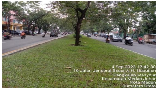
Gambar 4. Median Jalan