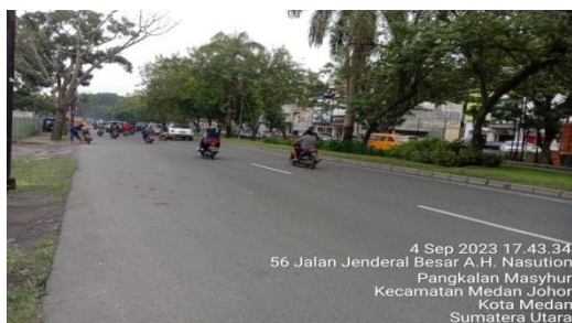
Gambar 5. Lajur Ruas jalan

Hasil Pengamatan dan pengukuran langsung dilapangan diperoleh data sebagai berikut :