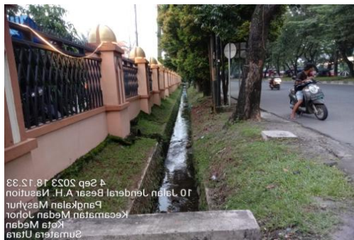
Gambar 5. Saluran Drainase tertutup dan terbuka