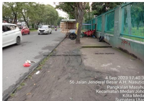
Gambar 3. Bahu jalan dan saluran drainase