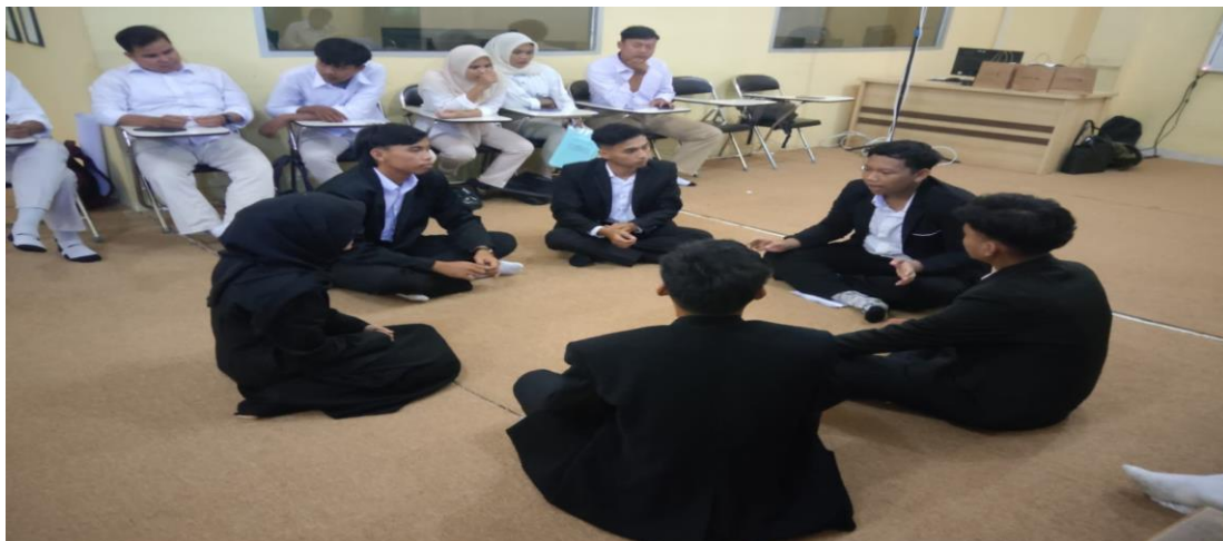
Gambar 2. Penilaian teman sejawat dilakukan pada pelaksanaan bimbingan kelompok dan memecahkan permasalahan dalam pembelajaran.

Pembelajaran berdiferensiasi menurut (Herwina, 2021), (Himmah & Nugraheni, 2023) dan (Wahyuningsari et al., 2022) didefinisikan sebagai pembelajaran yang berhambra pada kebutuhan peserta didik (mahasiswa) dimana strategi goal akhir bertumpu pada pencapaian proses bukan hasil akhir, sehingga pembelajaran ini bisa diterapkan untuk meningkatkan pengetahuan mahasiswa, keterampilan mahasiswa dan perubahan perilaku (sikap). Dalam penerapannya di penelitian ini pembelajaran berdiferensiasi disesuaikan berdasarkan kesiapan belajar (readness) mahasiswa agar tercapai peningkatan keterampilan memfasilitasi maupun keterampilan mengajar lainnya. Pembelajaran berdiferensiasi bukanlah pembelajaran yang difokuskan pada permasalahan pendidik namun pembelajaran yang mengakomodir kekuatan dan kebutuhan belajar peserta didik dengan skenario pembelajaran yang merdeka. Pembelajaran berdiferensiasi ini menuntut pendidik untuk memahami peserta didik secara terus menerus membangun kesadaran tentang kekuatan dan kelemahan peserta didik (Herwina, 2021), mengamati, menilai melalui refleksi bersama untuk memastikan bahwa setiap peserta didik mendapat