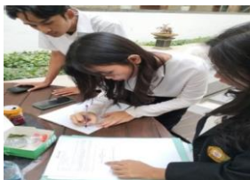
Gambar 3. Pengiriman surat Nota Dinas Keuangan Akuntansi DPRD Sumut 4. Pengiriman Surat Nota Dinas Keuangan Bendahara dan Fasilitas DPRD Provinsi Sumatera Utara.

Setelah mendapatkan arahan dari staff Komisi mahasiswa magang didampingi mahasiswa magang senior untuk pengiriman surat Nota Dinas keuangan akuntansi, yakni dengan menulis buku ekspedisi, meminta nomor surat di ruangan Tata Usaha dan diserahkan keruangan bendahara dan fasilitas DPRD Sumatera Utara.