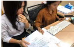
Gambar 1. Pembuatan jadwal kegiatan Komisi D bulan Desember

Sebelum mahasiswa magang membantu dan turun secara langsung, mahasiswa dijelaskan dan diarahkan oleh staff Komisi terkait tata cara penulisan dan memberikan agenda yang harus diisi kedalam jadwal kegiatan untuk bulan Desember 2024.