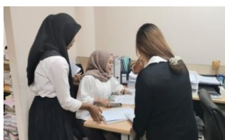
Gambar 4. Pengiriman Surat Nota Dinas ke Ruang Bendahara. 5. Pengiriman Surat Nota Dinas dan Meminta Tandatangani Ekspedisi Keuangan Wakil Ketua I DPRD Provinsi Sumatera Utara.

Setelah mendapatkan arahan dari staff Komisi mahasiswa magang didampingi mahasiswa magang senior untuk pengiriman surat Nota Dinas keuangan akuntansi, yakni dengan menulis buku ekspedisi, meminta nomor surat di ruangan Tata Usaha dan diserahkan keruangan bendahara dan fasilitas DPRD Sumatera Utara.