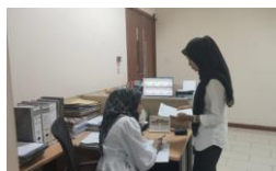
Gambar.15 Pengiriman Surat Kunjungan Kerja Dewan Komisi D

Mahasiswa diberikan penjelasan dan arahan untuk melakukan pengiriman surat Kunjungan Kerja Dewan Komisi D keruangan persidangan untuk mendapatkan tandatangan dan juga stempel.