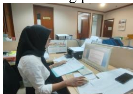
Gambar.9 Perbaikan Surat Permohonan Dewan Komisi D

9. Perbaikan Surat Permohonan Dewan Komisi D Setelah mendapatkan arahan dari staff untuk pembuatan surat permohonan Dewan Komisi D, mahasiswa melakukan kegiatan revisi ulang pada kesalahan-kesalahan penulisan surat.