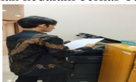
Gambar 6. Memfotocopy Berkas Nota Dinas Dewan Komisi D 7. Memfotocopy Berkas Surat SPPD (Surat Perintah Perjalanan Dinas) Dewan Komisi D

Mahasiswa diminta oleh staff komisi untuk menggandakan surat nota dinas Dewan Komisi D sebelum dikirimkan ke ruang akuntansi dan juga sebagai pertinggal dimasukkan berkas-berkas Komisi D.