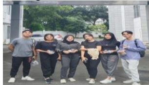
Gambar.10 Kegiatan Senam di DPRD Sumatera Utara

Sesuai dengan ketentuan dari pihak Tata Usaha DPRD Provinsi Sumatera Utara, dimana seluruh peserta magang ataupun anak PKL diwajibkan untuk mengikuti kegiatan senam rutin yang dilaksanakan pada hari Jumat. Kegiatan ini dilaksanakan untuk membantu peningkatan konsentrasi dan juga kebugaran sebelum melaksanakan aktivitas.