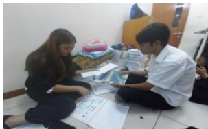
Gambar.8 Penataan Surat Nota Dinas Dewan Komisi D 2023-2024

8. Penataan Surat-Surat Nota Dinas Dewan Baru dan Lama Komisi D Mahasiswa magang diberikan intrupsi oleh staff untuk menata surat Nota Dinas Dewan Komisi D periode 2023-2024 kemudian dimasukkan kedalam satu berkas.