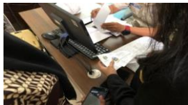
Gambar 13. Pengiriman Surat Rapat Dewan Komisi D

Mahasiswa magang diminta oleh staff untuk mengirimkan surat rapat dewan Komisi D dan meminta nomor surat keruangan tata usaha DPRD Sumatera Utara.