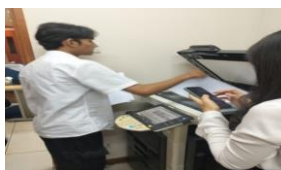
Gambar 7. Memfotocopy Berkas Surat SPPD Dewan Komisi D

Mahasiswa diminta oleh staff komisi untuk menggandakan surat nota dinas Dewan Komisi D sebelum dikirimkan ke ruang akuntansi dan juga sebagai pertinggal dimasukkan berkas-berkas Komisi D.