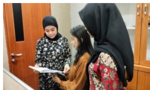
Gambar 5. Pengiriman Surat Nota Dinas Keuangan Wakil Ketua I DPRD Sumatera Utara 6. Memfotocopy Berkas Nota Dinas Dewan Komisi D Mahasiswa diminta oleh staff komisi untuk menggandakan surat nota dinas Dewan Komisi D sebagai pertinggal dan dimasukkan kedalam berkas-berkas Komisi D.

Mahasiswa diminta untuk mengirimkan surat Nota Dinas keuangan Wakil Ketua I DPRD Provinsi Sumatera Utara dengan membawa buku ekspedisi sebagai bukti telah diserahkan dan akan ditandatangani oleh penerima.