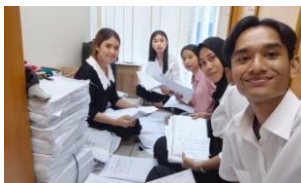
Gambar 12. Mencari Surat Nota Dinas Dewan Komisi D