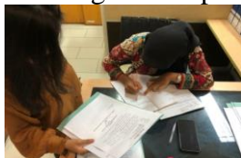
Gambar.14 Penulisan Buku Ekspedisi Nota Dinas Dewan Komisi D

Sebelum mahasiswa melakukan pengiriman surat menuju ruang tata usaha, mahasiswa diminta untuk menulis ekspedisi surat sebagai bukti penyerahan.