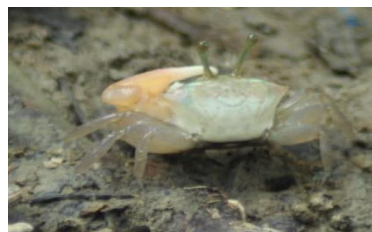
Gambar 1 : Spesies Uca jocelynae