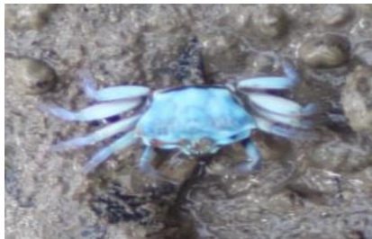
Gambar 2 : Spesies Uca tetragonon