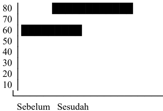
Grafik 3. Produksi UMKM Ikan Asin