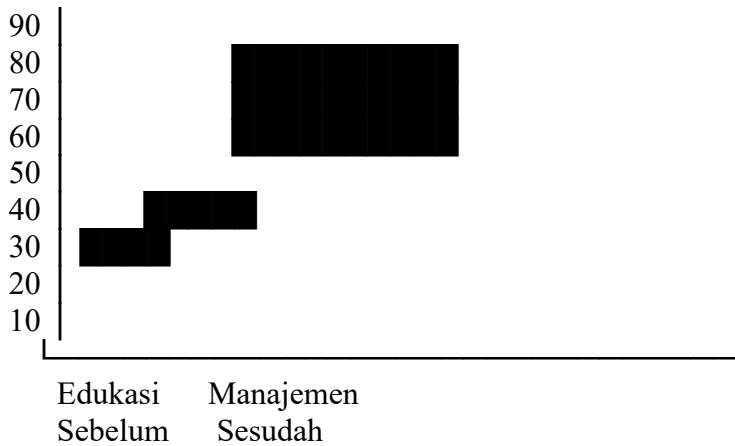
Grafik 2. Partisipasi Masyarakat Posyandu