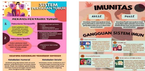
Gambar 3. Media Poster dan Proses Pembelajaran