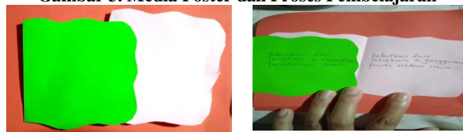
Gambar 4. Kartu Soal Saat Tournament