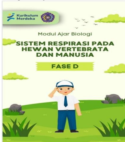
Gambar 2. Tampilan Media

Pengembangan produk dengan kualitas layak itulah yang dimaksud dengan tahap pengembangan ini. Langkah selanjutnya melibatkan pengujian kelayakan produk, yang akan dikonfirmasi selama proses pembelajaran.