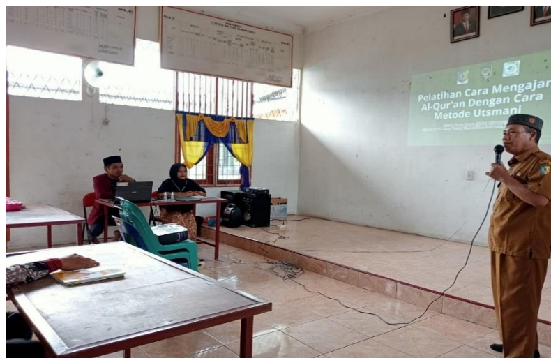
Gambar 1. Kegiatan Pelatihan Metode Ustmani