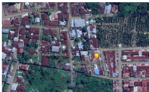
Gambar 2. Lokasi Perancangan PLTS

Setelah melakukan studi literatur, maka dilakukan observasi lokasi didapatkan bahwa lokasi pada perancangan Pembangkit Listrik Tenaga Surya (PLTS) untuk Supply Aerator pada Kolam Bioflok yang berada di Tanjung Rhu, Lima Puluh, Pekanbaru kota yang bertitik koordinat 0,5380332, 101,4653391, pada Gambar 2 berikut, menampilkan lokasi perancangan tersebut.