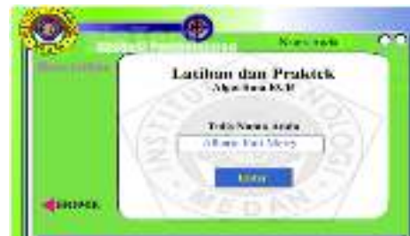
Gambar 9. Halaman Pembuka Latihan Dan Praktek