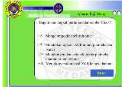
Gambar 7. Pertanyaan Dan Respon

Gambar 7 di bawah merupakan halaman dari pertanyaan yang akan disajikan