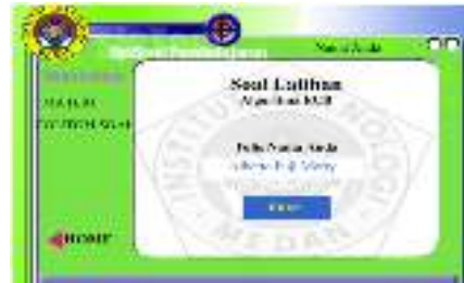
Gambar 6. Halaman Pembuka Pertanyaan

Gambar 7 di bawah merupakan halaman dari pertanyaan yang akan disajikan