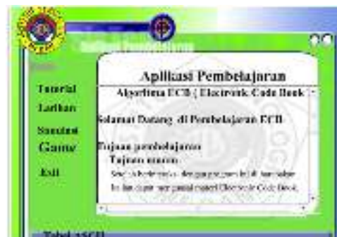
Gambar 2. Halaman Utama

Halaman utama merupakan halaman perbuka dari aplikasi yang dirancang adapun menu dari aplikasi pembelajaran yang dirancang antara lain :