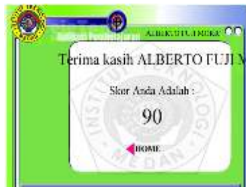
Gambar 11. Halaman Hasil Evaluasi

Gambar 11, merupakan tampilan penilaian dari soal yang disajikan