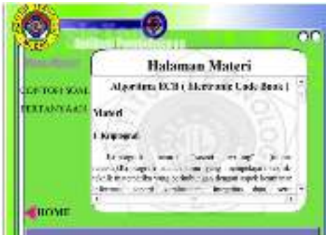
Gambar 4. Tampilan Halaman Materi