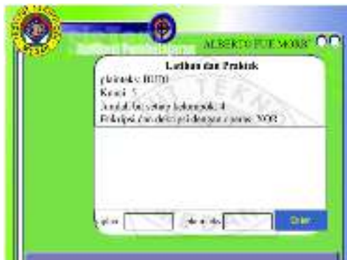
Gambar 10. Halaman Soal Latihan Dan Praktek

Gambar 10, merupakan tampilan dari soal yang akan disajikan