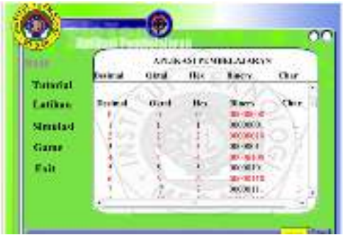
Gambar 3. Halaman Tabel ASCII