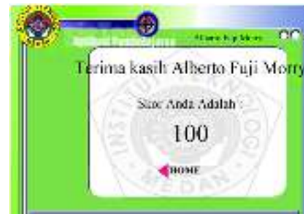
Gambar 8. Halaman Penilaian

Setelah seluruh pertanyaan terjawab maka aplikasi akan memberikan penilaian dari jawaban-jawaban yang di inputkan peserta didik.