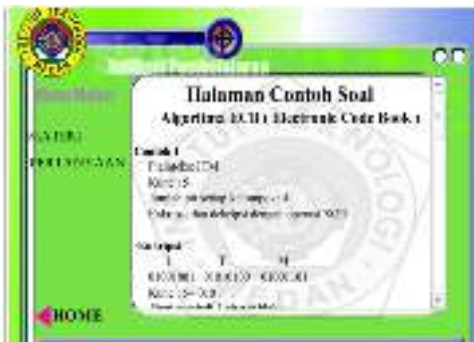
Gambar 5. Tampilan Halaman Contoh Soal