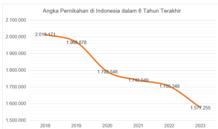
Gambar 1. Angka Pernikahan di Indonesia

Seiring dengan perkembangan zaman dan bergesernya nilai-nilai dalam kehidupan masyarakat, banyak hal turut mengalami perubahan. Salah satu perubahan yang mencolok ialah gaya hidup dan perilaku Generasi Z, yang lahir antara tahun 1997 sampai dengan 2012 (Arum et al., 2023). Dalam konteks ini, fenomena yang menarik perhatian di kalangan Generasi Z adalah pergeseran pandangan mereka terhadap pernikahan. Bagi Generasi Z, pernikahan tidak lagi menjadi fase kehidupan yang diprioritaskan. Hal ini didukung oleh laporan Badan Pusat Statistik Indonesia tahun 2024 yang menemukan bahwa angka pernikahan terus mengalami penurunan. Pada tahun 2023, jumlah pernikahan di Indonesia tercatat sebanyak 1.577.255, turun sekitar 128 ribu dari angka pernikahan di tahun 2022 yang mencapai 1.705.348 (Badan Pusat Statistik, 2024). Jika ditarik lebih jauh ke belakang, laporan Statistik Indonesia 2022 dan 2021 menunjukkan bahwa angka pernikahan di Indonesia terus menurun dalam enam tahun terakhir.