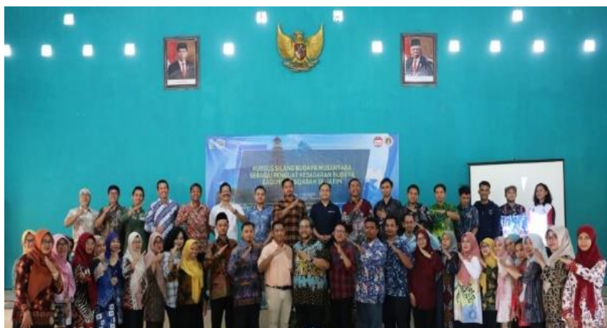
Gambar 1. Kursus Silang Budaya Nusantara

Setelah pemaparan materi, para peserta diberikan kesempatan untuk bertanya dan berdiskusi dengan para narasumber. Hal ini sebagai bentuk partisipasi peserta untuk turut aktif dalam kursus dengan memberikan pertanyaan seputar potensi-potensi sejarah lokal yang dapat dihubungkan dengan silang budaya nusantara. Pada sesi tanya jawab ini antusiasme yang sangat tinggi ditunjukkan oleh para peserta kursus. Utamanya dalam memahami dan memperkuat kesadaran akan budaya serta dalam mengembangkan kompetensi profesionalismenya sebagai seorang guru.