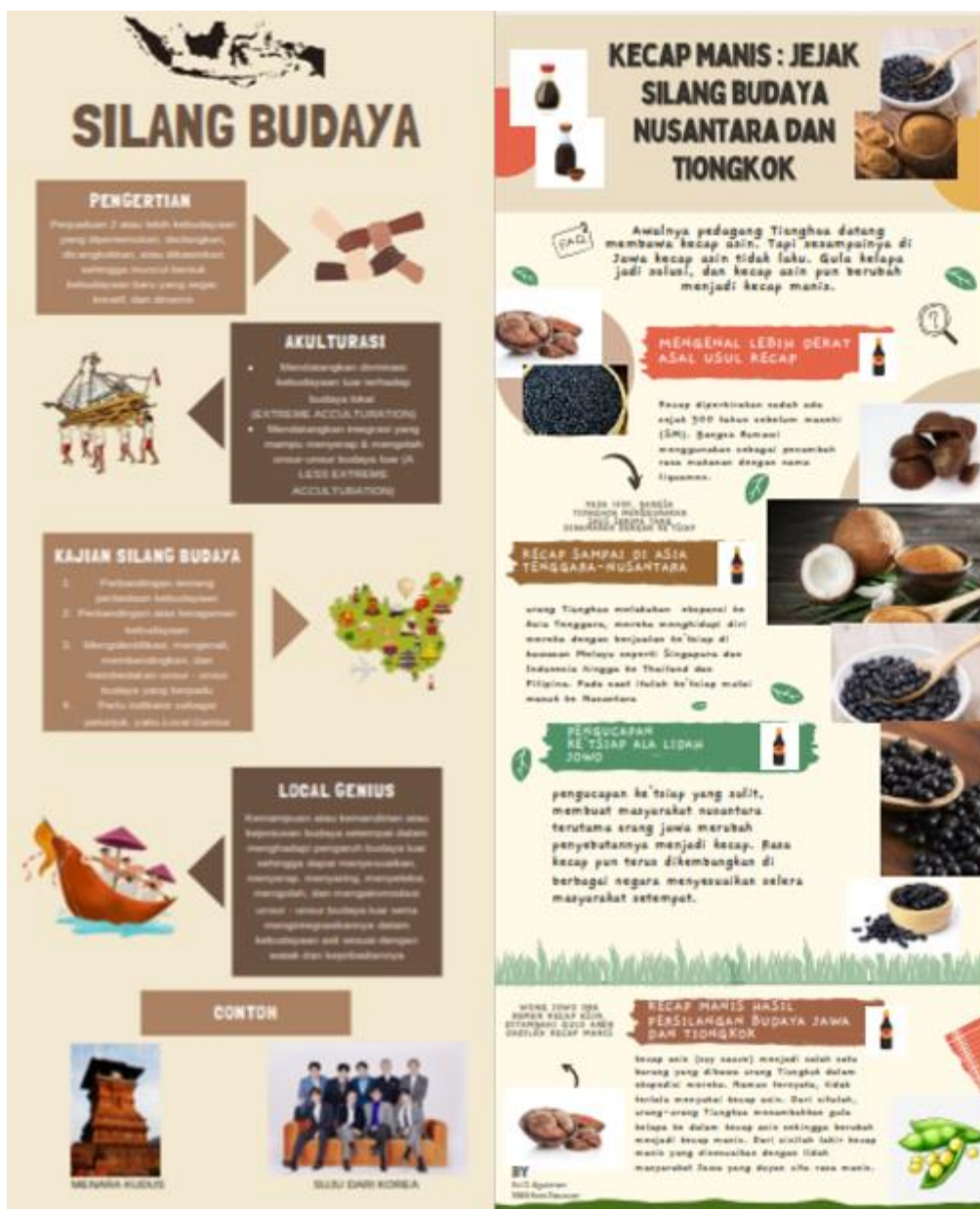
Gambar 5. Sampel Infografis Peserta Kursus Silang Budaya Nusantara