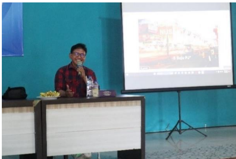
Gambar 3. Sesi Pemaparan Materi

dimulai dengan intermezzo mengenai kesadaran sejarah, bentuk-bentuk dari silang budaya serta pengaruh budaya dari luar yang secara tidak langsung tanpa disadari telah bermanifestasi menjadi suatu rekayasa. Kemudian materi ketiga disampaikan oleh Dr. Deny Yudo Wahyudi, S.Pd., M.Hum, bertajuk “Candi Jawi: Pendharmaan Sang Siwa-Buddha”. Berbeda dengan materi sebelumnya, materi ketiga ini lebih terfokus pada penyampaian dari wujud silang budaya itu sendiri, yakni Candi Jawi. Materi ketiga ini dibuka dengan pemaparan singkat mengenai lokasi Candi Jawi dan keunikannya. Materi terakhir disampaikan oleh Dr. Daya Negri Wijaya, S.Pd., M.A., mengenai kondisi geopolitik Pasuruan dalam catatan Fernao Mendes Pinto. Pemaparan mengenai kondisi geopolitik Pasuruan diawali dengan menengok kembali mengenai eksistensi Jawa pada abad XVI. Di mana semua informasi di Jawa serta Asia Tenggara bersumber pada kronik dan arsip Portugis.