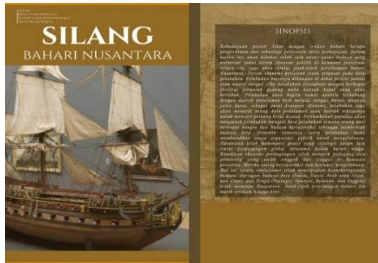
Gambar 2. Buku Pedoman Kegiatan Kursus Silang Budaya Nusantara

Pada tahap ini juga dilakukan penyusunan buku berjudul “Silang Bahari Nusantara” yang berisi mengkaji tentang pelabuhan-pelabuhan Nusantara dan pengaruhnya terhadap kebudayaan yang ada di Nusantara, baik pada masa Hindu-Buddha hingga masa kolonialisme. Buku ini diharapkan menjadi pedoman bagi peserta ketika memahami materi yang akan diberikan oleh narasumber. Selain itu buku ini juga diharapkan menjadi pengetahuan baru bagi guru agar diimplementasikan di sekolah utamanya ketika pembelajaran di kelas. Hal ini karena dalam kurikulum merdeka guru diberikan kebebasan untuk memilih materi apa saja yang akan diberikan kepada siswa selama tidak keluar dari capaian pembelajaran (Marlina, 2023 ; Nurcahyono & Putra, 2022 ).