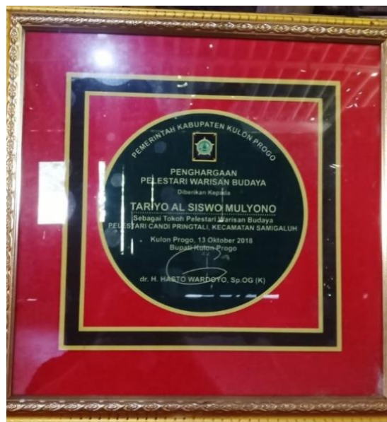
Gambar 5. Piagam Penghargaan Tokoh Pelestari Warisan Budaya 2018 kepada Tariyo Al Siswo Mulyono Sumber: Dokumentasi Pribadi, 17 Mei 2024

Atas kontribusinya tersebut, Tariyo Al Siswo Mulyono menerima penghargaan sebagai Tokoh Pelestari Warisan Budaya dari Pemerintah Kabupaten Kulon Progo pada tahun 2018.