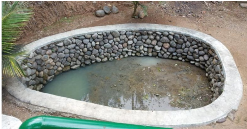
Gambar 4. Sendang Candi Pringtali Setelah Ditemukan dan Direvitalisasi

Pada tahun 2017, Dinas Kebudayaan Kulon Progo mendorong masyarakat untuk menghidupkan kembali sendang (mata air) yang sempat tertimbun longsor sejak tahun 1988. Tariyo Al Siswo Mulyono kemudian menginisiasi pencarian sumber air ini bersama masyarakat. Setelah dua kali kegiatan gotong royong, sendang berhasil ditemukan dan direstorasi, sehingga kembali mengalir dan memberikan manfaat ekologis maupun spiritual (Wawancara dengan Tariyo Al Siswo Mulyono, 27 Oktober 2024).