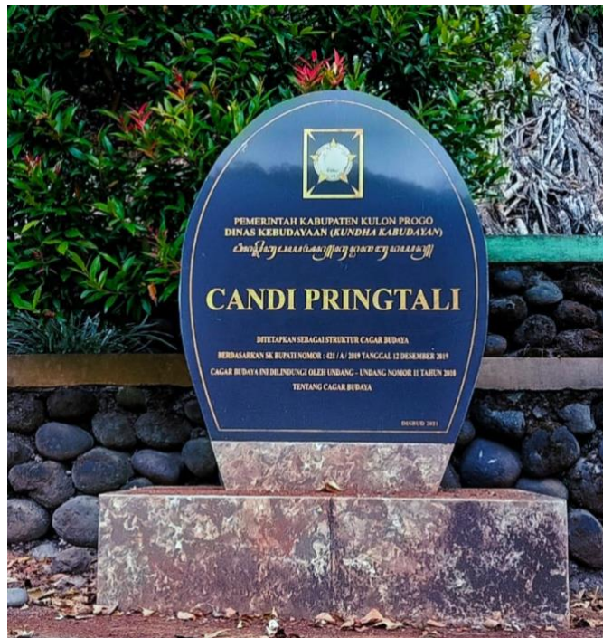
Gambar 8. Prasasti Penetapan Candi Pringtali sebagai Cagar Budaya Kabupaten Kulon Progo

Setelah proses revitalisasi, pada tanggal 8 Agustus 2019, Tim Ahli Cagar Budaya (TACB) Daerah Istimewa Yogyakarta mengajukan rekomendasi penetapan Candi Pringtali sebagai struktur cagar budaya kepada Pemerintah Kabupaten Kulon Progo. Rekomendasi tersebut dituangkan dalam dokumen bernomor 11/TACB-KP/VI/2019 yang secara resmi menyatakan bahwa Candi Pringtali memenuhi kriteria sebagai cagar budaya daerah.