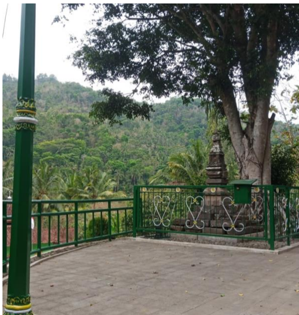
Gambar 7. Pagar Besi Hasil Revitalisasi Komplek Candi Pringtali Tahun 2019 Sumber: Dokumentasi Pribadi, 27 Oktober 2024

Setelah proses revitalisasi, pada tanggal 8 Agustus 2019, Tim Ahli Cagar Budaya (TACB) Daerah Istimewa Yogyakarta mengajukan rekomendasi penetapan Candi Pringtali sebagai struktur cagar budaya kepada Pemerintah Kabupaten Kulon Progo. Rekomendasi tersebut dituangkan dalam dokumen bernomor 11/TACB-KP/VI/2019 yang secara resmi menyatakan bahwa Candi Pringtali memenuhi kriteria sebagai cagar budaya daerah.