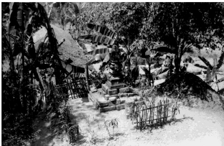
Gambar 2. Hasil Penyelamatan Candi Pringtali pasca-Rubuh Tahun 1994