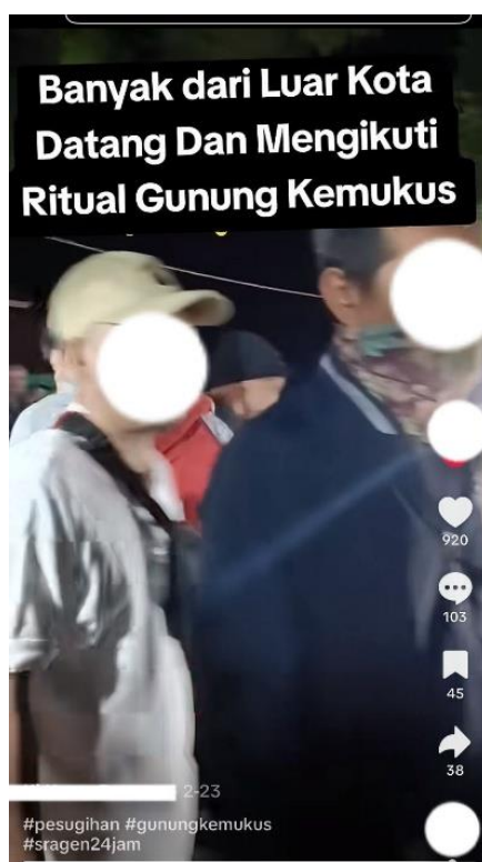
Gambar 3. Konten TikTok tentang Ritual di Gunung Kemukus

Konten-konten yang membangun representasi tersebut umumnya menampilkan visual kawasan pada malam hari, keramaian pengunjung, musik bernuansa mistis, serta caption dan narasi yang mengaitkan Gunung Kemukus dengan ritual pencarian kekayaan. Judul maupun caption seperti “ pesugihan Gunung Kemukus”, “ritual malam Jumat Pon”, dan “ritual cepat kaya” digunakan untuk menarik perhatian audiens sekaligus memperkuat citra mistis kawasan tersebut. Pemilihan unsur-unsur visual dan naratif tersebut mengarahkan audiens pada pemaknaan bahwa Gunung Kemukus identik dengan praktik ritual yang bersifat kontroversial. Strategi representasi tersebut menunjukkan bahwa konten kreator memanfaatkan aspek sensasional sebagai daya tarik utama dalam produksi konten digital.