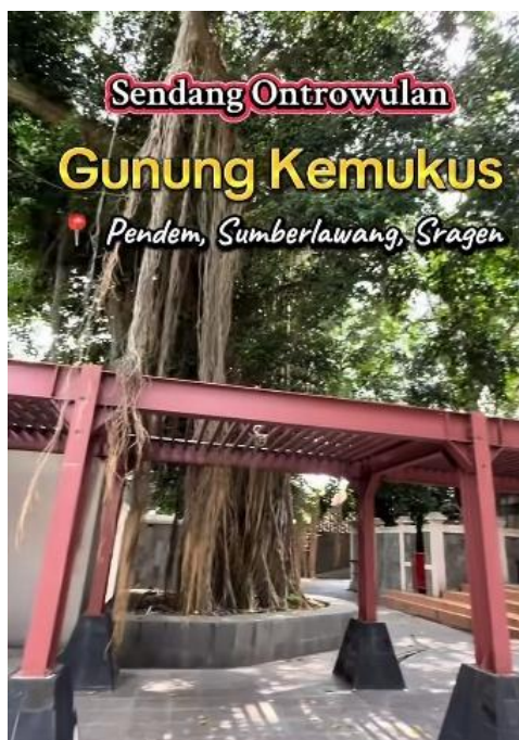
Gambar 1. Konten TikTok tentang Gunung Kemukus

Hasil penelitian menunjukkan bahwa sebagian konten TikTok merepresentasikan Gunung Kemukus sebagai kawasan wisata religi, budaya, dan sejarah. Konten-konten tersebut menonjolkan makam Pangeran Samudera sebagai tujuan ziarah, tradisi Larap Slambu sebagai warisan budaya masyarakat, serta narasi sejarah yang menghubungkan Pangeran Samudera dengan Kerajaan Majapahit dan Kesultanan Demak. Pemilihan visual dan narasi tersebut mengarahkan audiens untuk memandangi Gunung Kemukus sebagai ruang yang memiliki nilai spiritual, historis, dan budaya yang tetap terpelihara hingga saat ini. Representasi tersebut memperlihatkan adanya upaya membangun identitas alternatif yang berbeda dari stigma negatif yang selama ini berkembang.