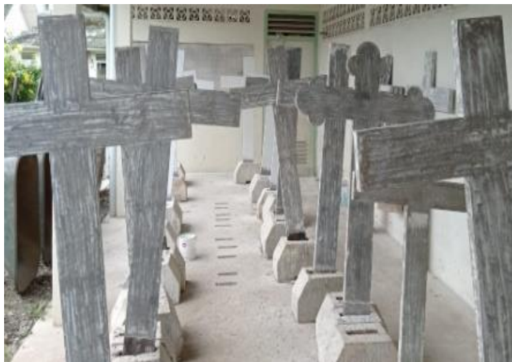
Gambar 7. Batu nisan di Ereveld Leuwigajah