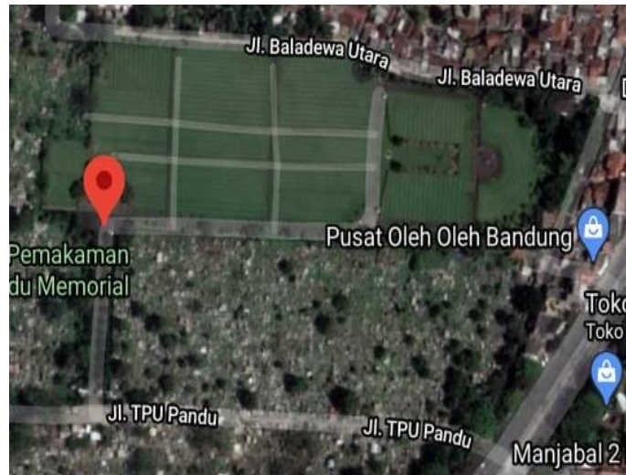
Gambar 3. Struktur denah Erevelde Pandu yang dibuat menyerupai pedang jika dilihat dari atas