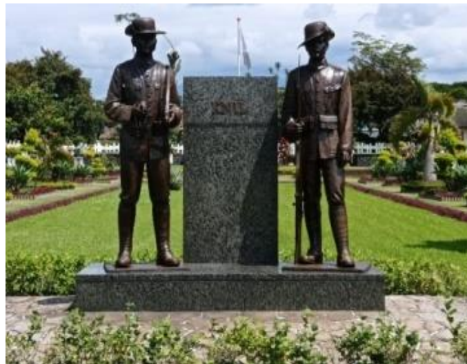
Gambar 4. Monumen KNIL yang terletak di Erevelde Pandu, Kota Bandung