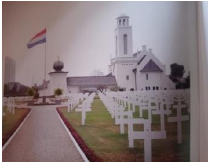
Gambar 1. Ereveld Menteng Pulo di Jakarta dengan Gereja Simultaan sebagai ciri khasnya

Norfaizi, H., Hassanah, D.N., & Ichsan, I.N. (2023). Telisik Kisah Tersembunyi dari Makam Kehormatan di Bandung: Ereveld Pandu dan Leuwigajah. MUKADIMAH: Jurnal Pendidikan, Sejarah, dan Ilmu-Ilmu Sosial , 7(2), 502-513.