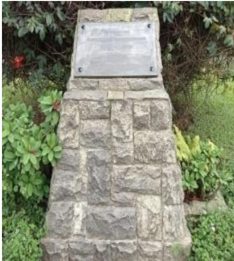
Gambar 6. Monumen Junyo Maru di Ereveld Leuwigajah yang bertuliskan “ Herdenking Slachtoffers Zeetransporten 1942-1945 Stichting Junyo Maru ”