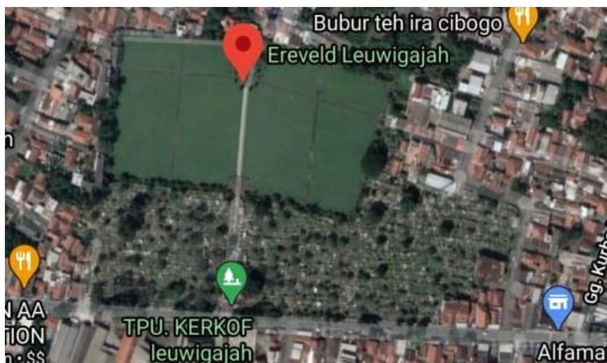
Gambar 5. Denah Erevelde Leuwigajah di Cimahi yang dapat diakses melalui TPU Kerkhof Leuwigajah