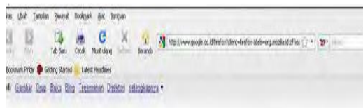
Gambar 2 Column memanjang

3. Pada halaman di atas terdapat column memanjang yang tertulis address atau tampilan sperti ini :